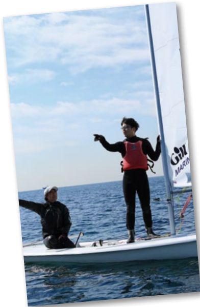
風を見る練習中。海面の濃淡や動きで、海面近くの風の強弱や方向を見極める。これからフネに影響を与えるであろう風を探することは、速く進むためだけでなく、安全面でも重要となる