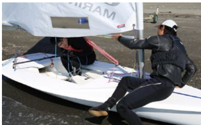
まずは、陸上でのシミュレーションから。ここまで体を曲げないと、ブームの下をくぐるができない