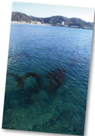
冬の海はとてもキレイ。海藻だけでなく、海底まで丸見え

は落ちるので、理想としては、できる限りハイアウトでオーバーヒールを抑え込みたいところだが、別にレースをしているわけではないので、今のところ、そこまで深く考える必要もない。