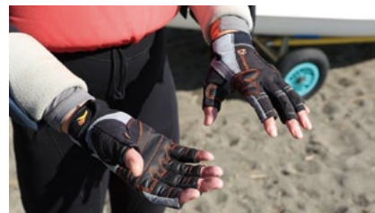
購入したセーリンググローブ。ウエア類と同じ、クルーセイバー製なので、統一感がある。フィット感などが大事になるので、実際に試してみることが大事