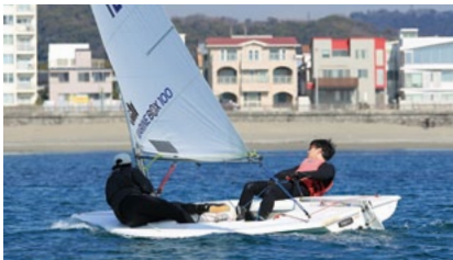
シーホッパーは、ヒールしやすいので、ハイクアウトするか、シートを出してセール風の風を逃がすかして、艇をフラットに保つ

小さいので、とてもバランスが悪い。そのため常に微妙なバランスや傾き、感覚に神経を尖らせておく必要がある。また、ブームの位置が低く、タッキングやジャイビングのとき、ひれ伏すように体を曲げて、艇の反対側へ移動しなくてはならない。つまり、やること、考えることが多いのだ。早速、怖じけづく私であったが、百聞は一セリングに如かず。海へ行きましょうといういつもの流れ。