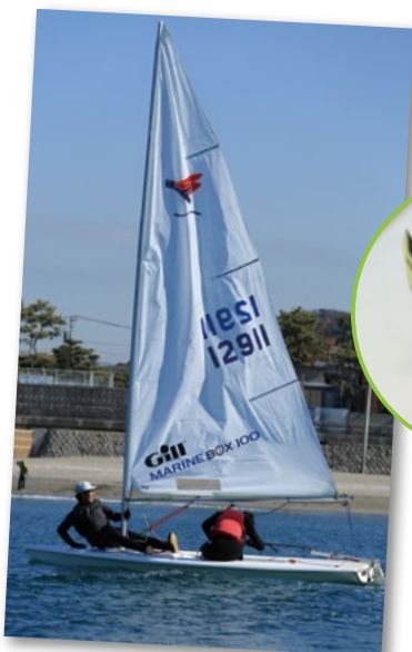
タッキングに挑戦中。ブームに当たらないよう、体を思いきり曲げているので、ほとんど前が見えていない。これは駄目なパターン

風見。この日乗船したシーホッパーは、新品のセールを使用していたので、テルテルがなく、風を知るときに、この風見が大変役に立った