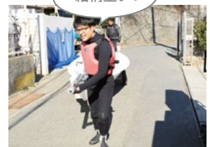
結構重い！艇庫から浜辺へ（およそ50m）フネを運ぶ