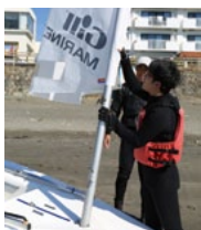
マストを立てるなど、できることは自分でやる