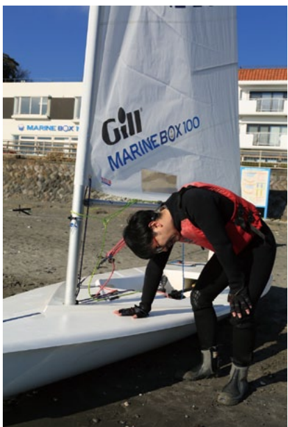
夕方、風が落ちたところで、1日目は終了。窮屈な姿勢が続き、使ったことのない筋肉が悲鳴を上げる

とにかく、初日はこれの繰り返し。アビーム、クローズホールド、ランニング、タッキング、ジャイビング……。時間と風が許すまで、