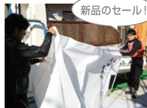
新品のセール！セールをマストに通す。下ろしたての新品セールだ