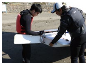
浸水しないよう、ドレーンプラグをはめ込む