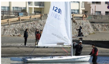
フネを海に浮かべる。常にフネが風上を向くようにする。バウを軽く持てば、風向きに合わせて、自分を中心にフネが勝手に移動してくれる