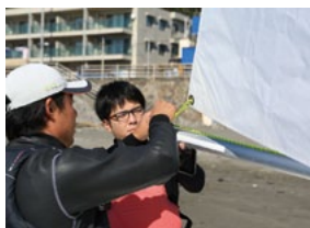
艀装。初日なので、まずは見学から。覚えることが多い!