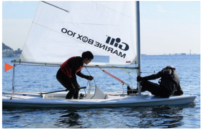
本来なら、ブームが頭の上を通ったあと、つかんだシートを離さなくてはならないが、テンパって離さずにいる。このクセは、この日最後まで抜けなかった