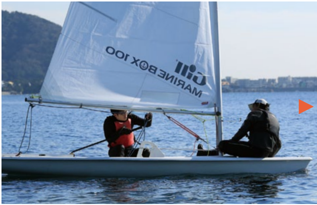
ほとんど風が落ちたなかで、ジャイビングに挑戦中。艇が風軸を越えるときに、シートをつかんで後ろに放り投げ、それと同時に、反対側の舷に移る